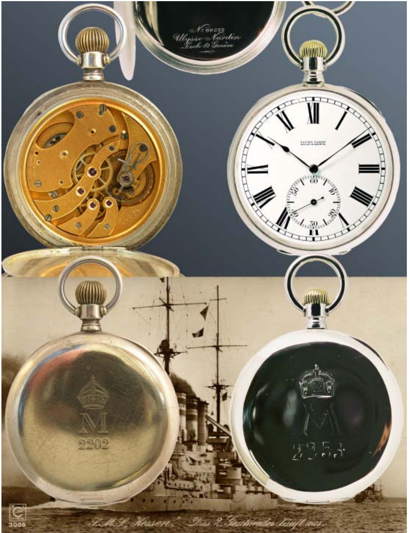
Beobachtungsuhren der Kaiserlichen Marine: Ulysse Nardin Le Locle, 800er Silber, Kaiser-Krone und Marine-Registrierung, Emailzifferblatt, vergoldetes 22''' Brücken-Ankerwerk mit Schwanhals-Feinregulierung, 16 Steine. - Nr. 66522, Marine-Nr. 'M 2253'.

Navigation watches for the Imperial Navy by Ulysse Nardin in silver case, marked with Imperial Crown and M, gold finish bridge movement of 22''' with swan neck, 16 jewels. - no. 66522, reg. no. 'M 2253'.