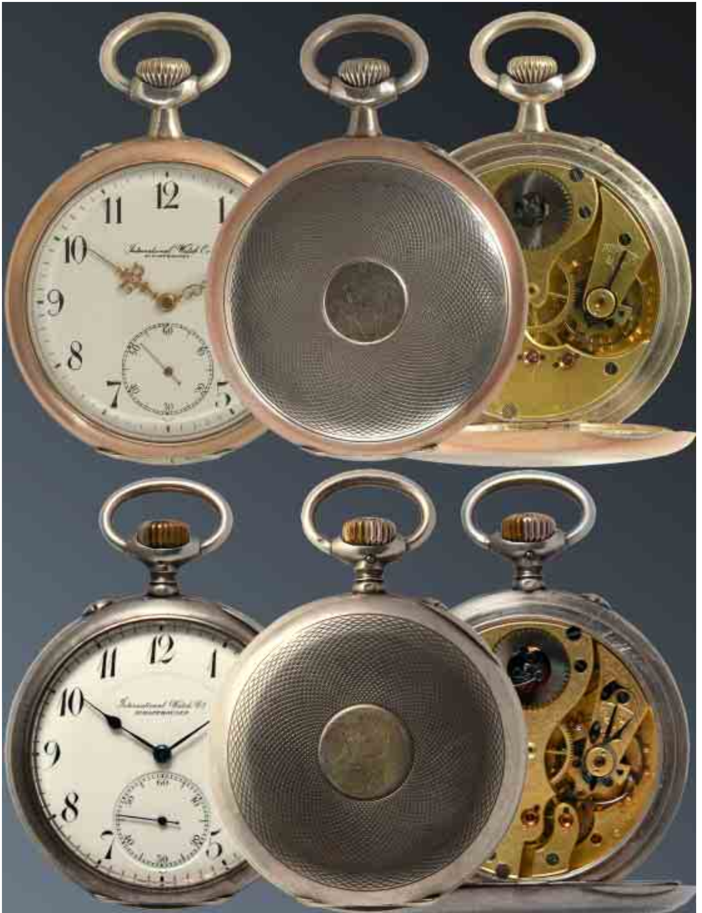
Beobachtungsuhren für die Kaiserliche Marine: International Watch Co. Schaffhausen/Schweiz, Silber-Gehäuse mit zwei Scharnierdeckeln, weißes Email-Zifferblatt, Markierung der Kaiserlichen Marine Krone und 'M'. - oben: IWC Taschenuhr Geh. Nr. 471743, Werk Cal. 57, Nr. 444955 von 1909, unten: IWC B-Uhr Cal. 52 mit Feinreglage, vergoldetes 2/3 Platinenwerk von 1914. (Privatbesitz, Fotos K. Knirim Juli. 2003)